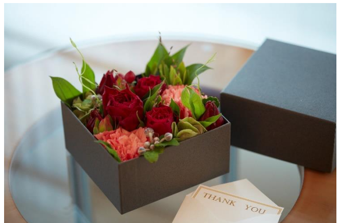
「メッセージを添えたフラワーボックス」で感謝を伝える宿泊プラン