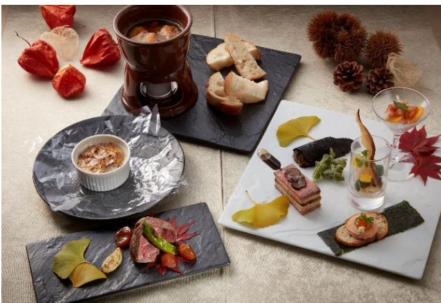
ボム・ダダン「秋の収穫祭」