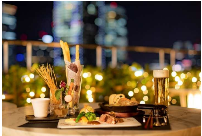
夜景をバックに、ビールにぴったりなお料理を堪能！