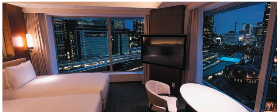
グランドコーナー ツイン Grand Corner Twin

We look forward to welcoming you to one of our 201 non-smoking rooms. Choose from 11 room types.