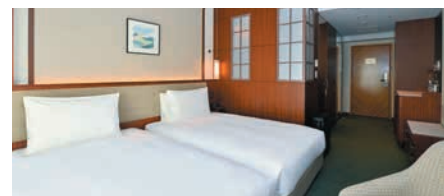
モデレート ツイン Moderate Twin